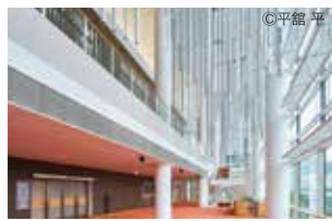
光溢れる横浜みなとみらいホールのロビー