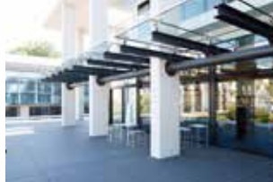
神奈川県立図書館本館3階のオープンテラス