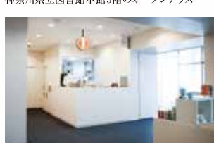
神奈川県立図書館本館内の旗田彦珈琲が 運営するライブラッシュアップ