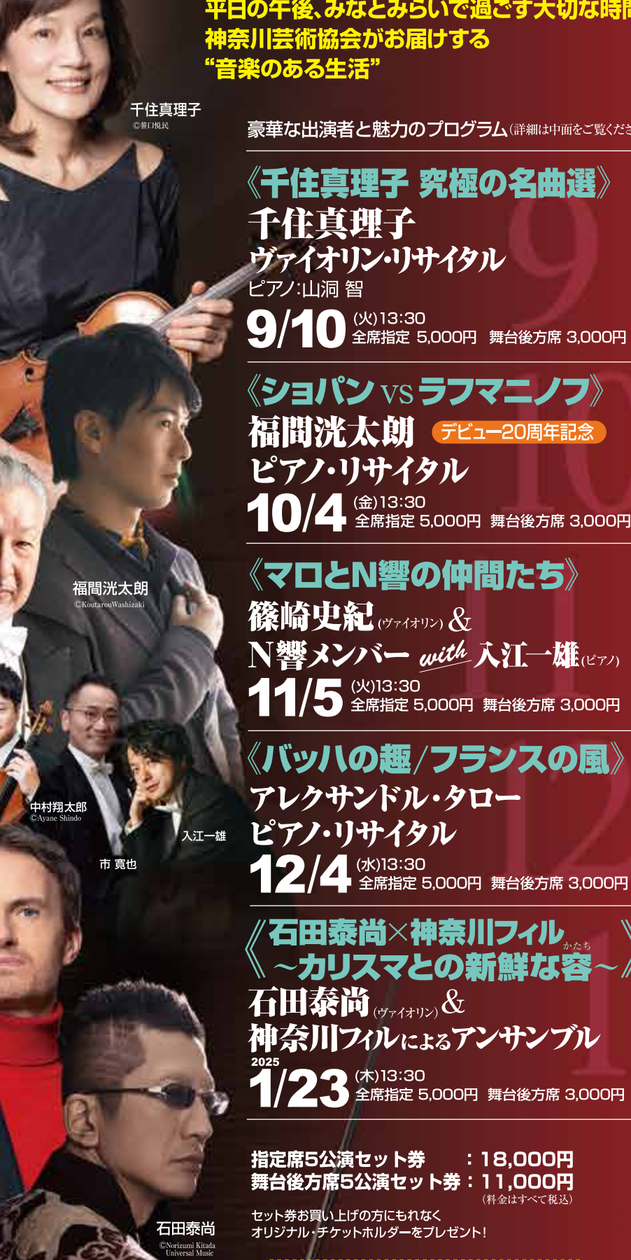
千住真理子 ©T.MIURA 山洞 智 篠崎史紀 ©T.MIURA 福岡光太郎 ©Kotaro Wakahara 入江一雄 市 寛也 中村陽太郎 ©Yasuo Shibata 倉富亮太 アレクサンドル・タロー 石田泰尚 ©Netzami Kinda / Universal Music