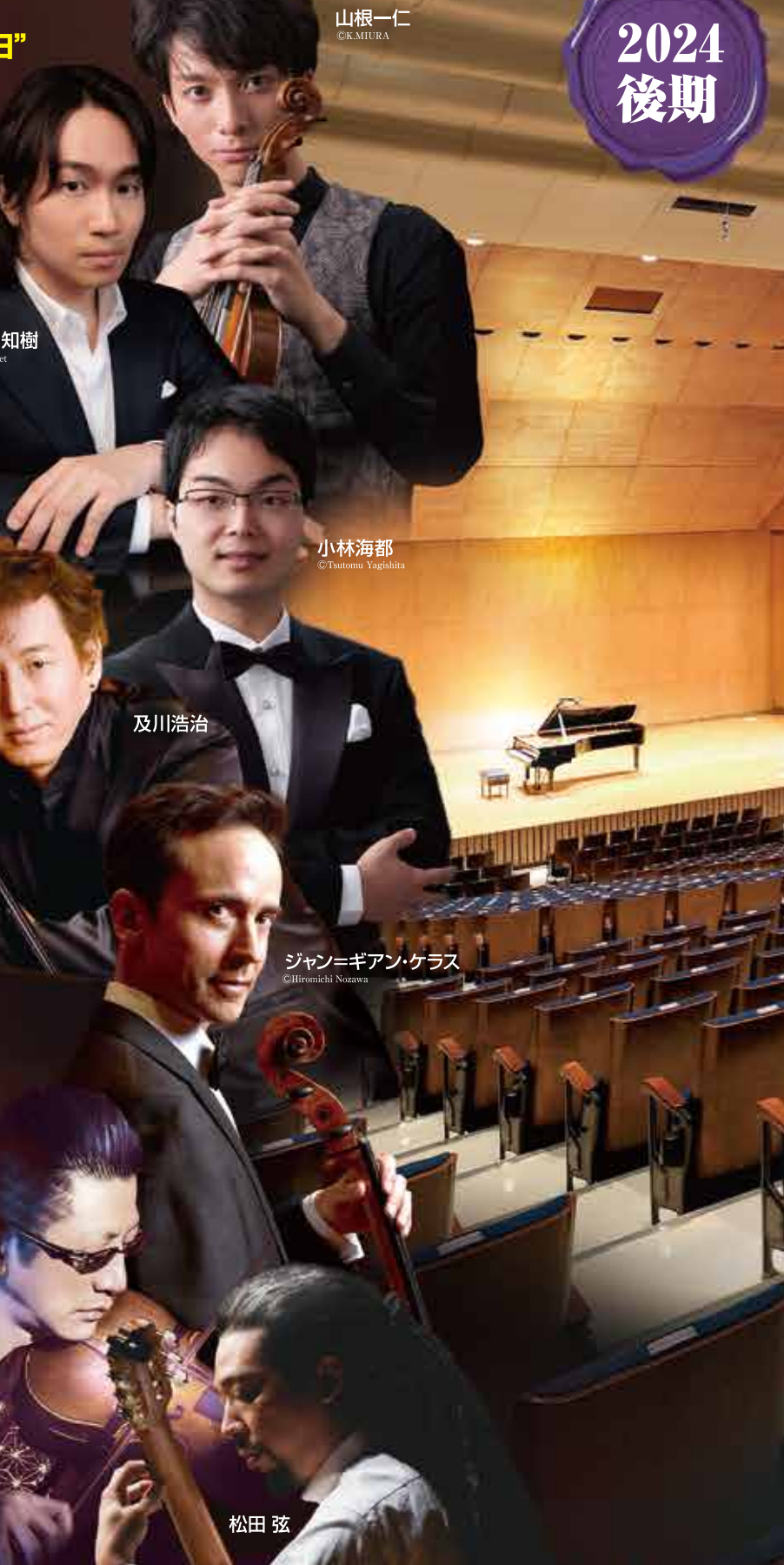
山根一仁 ©K.MIURA 阪田知樹 ©Ayoumi 小林海都 ©Toshimasa Yagihata 及川浩治 ジャン＝ギアン・ケラス ©Jihrenki Nozawa 石田泰尚 ©Shota Tamaki / Universal Music 松田 弦

70th 会場：神奈川県立音楽堂 (JR市営地下鉄「桜木町駅」徒歩約10分) 無料シャトルバス運行あり(予約制) 詳しくはプレイガイド一見ページへ 主催：神奈川芸術協会 共催：神奈川県立音楽堂(協賛者：公益財団法人神奈川音楽文化財団)