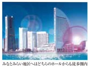
みなとみらい地区へはどちらのホールからも徒歩圏内